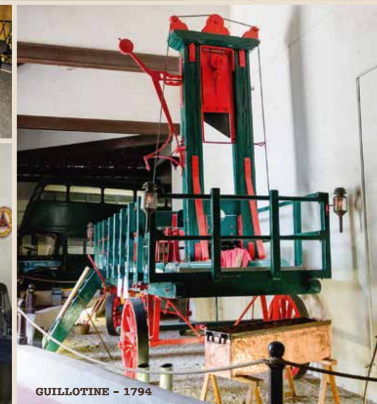
GUILLOTINE - 1794